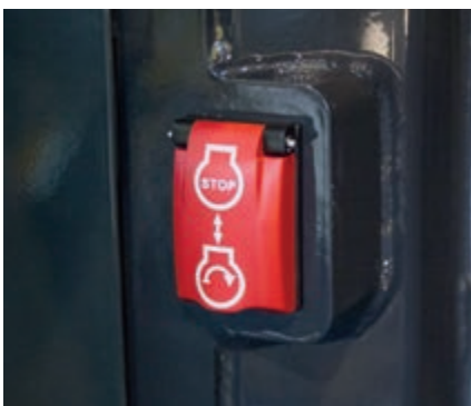
Interrupteur d'arrêt secondaire du moteur